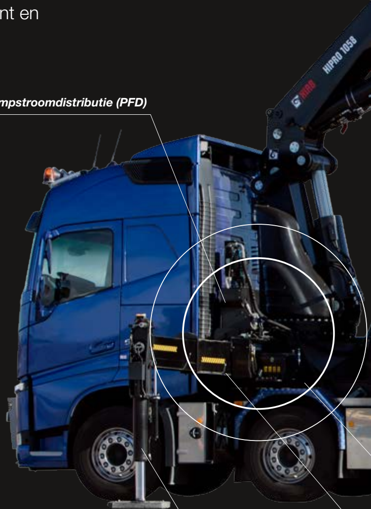
Eenvoudig kantelen van steunpoten