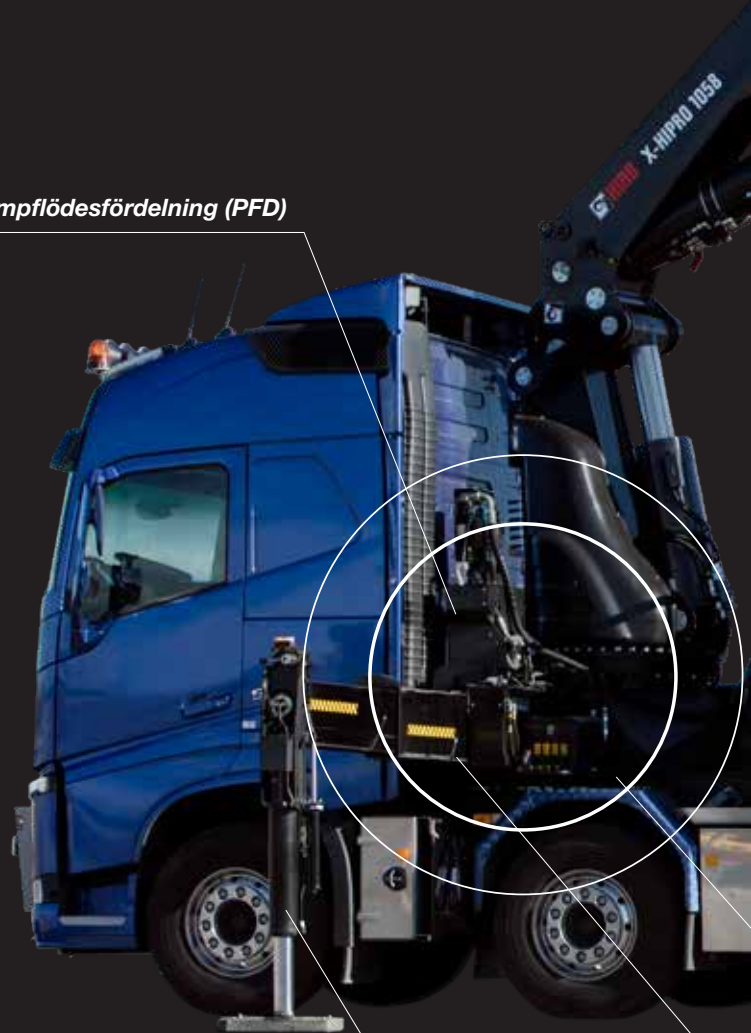
Enkel uppsvängning av stödben