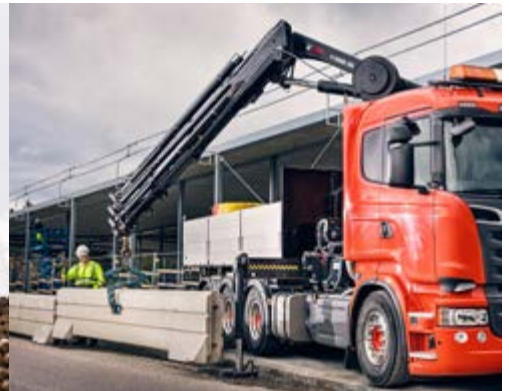
HIAB X-HiDuo 228